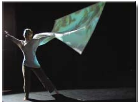
Chantecler (2005) Metaphora (2006-2008)

Parallèlement à ses créations purement professionnelles, la Compagnie Intersignes, installée depuis sa fondation dans le sud-ouest lyonnais, s'est très fortement impliquée dans la vie culturelle de ce secteur, étant l'instigatrice et le moteur d'une mobilisation importante des ressources et des populations : la Compagnie a,